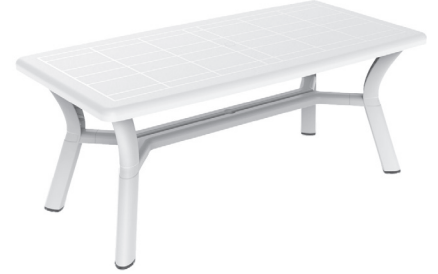
Table injectée en polypropylène avec pieds reliés pour une meilleure stabilité. Trou parasol 38 mm. Taquets réglables et anti-dérapants.