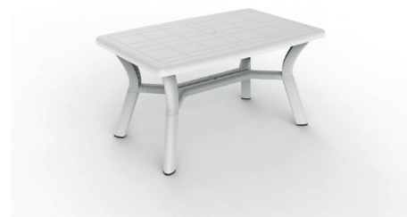
Table injectée en polypropylène avec pieds reliés pour une meilleure stabilité. Trou parasol 38 mm. Taquets réglables et anti-dérapants.